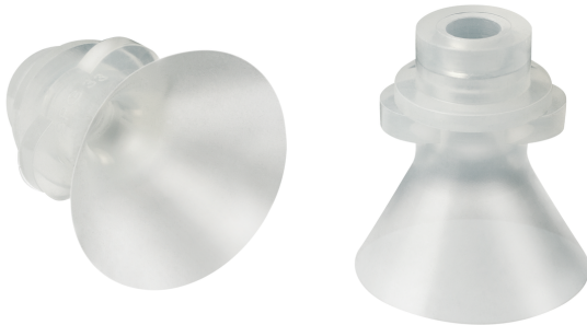
Ventouses pour chocolat SPG