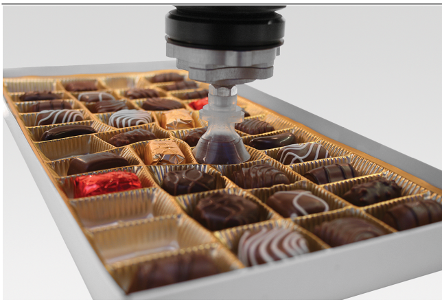
Ventouses pour chocolat SPG pour la manipulation de chocolats